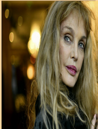
CONSTANCE Arielle Dombasle