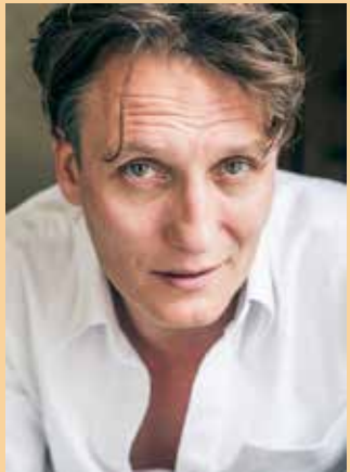
Oliver Masucci