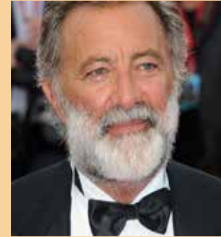
BONGO MINETTI Luca Barbareschi